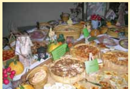
das külsheimer vesper-buffet