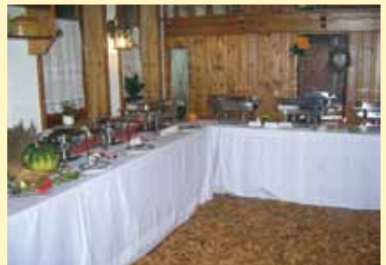
individuell ausgerichtetes bankett mit herbstlaub