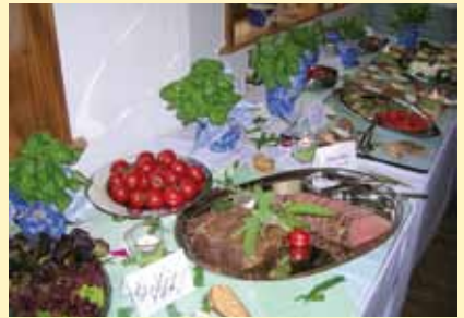
mediterranes buffet mit antipasti und frischen salaten