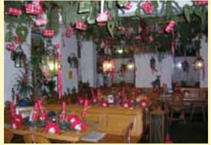
unser liebevoll weihnachtlich dekoriertes restaurant